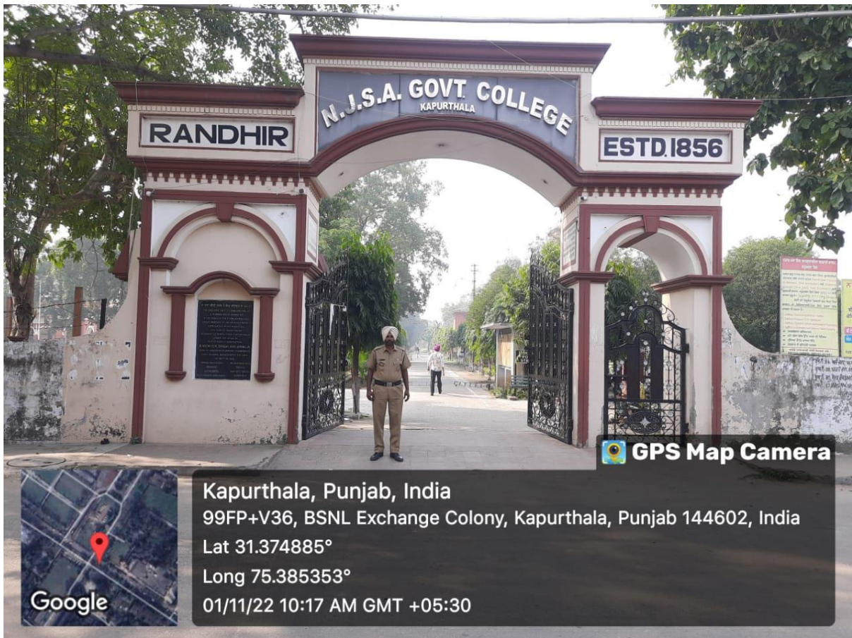
Security system at the Entrance of the College.