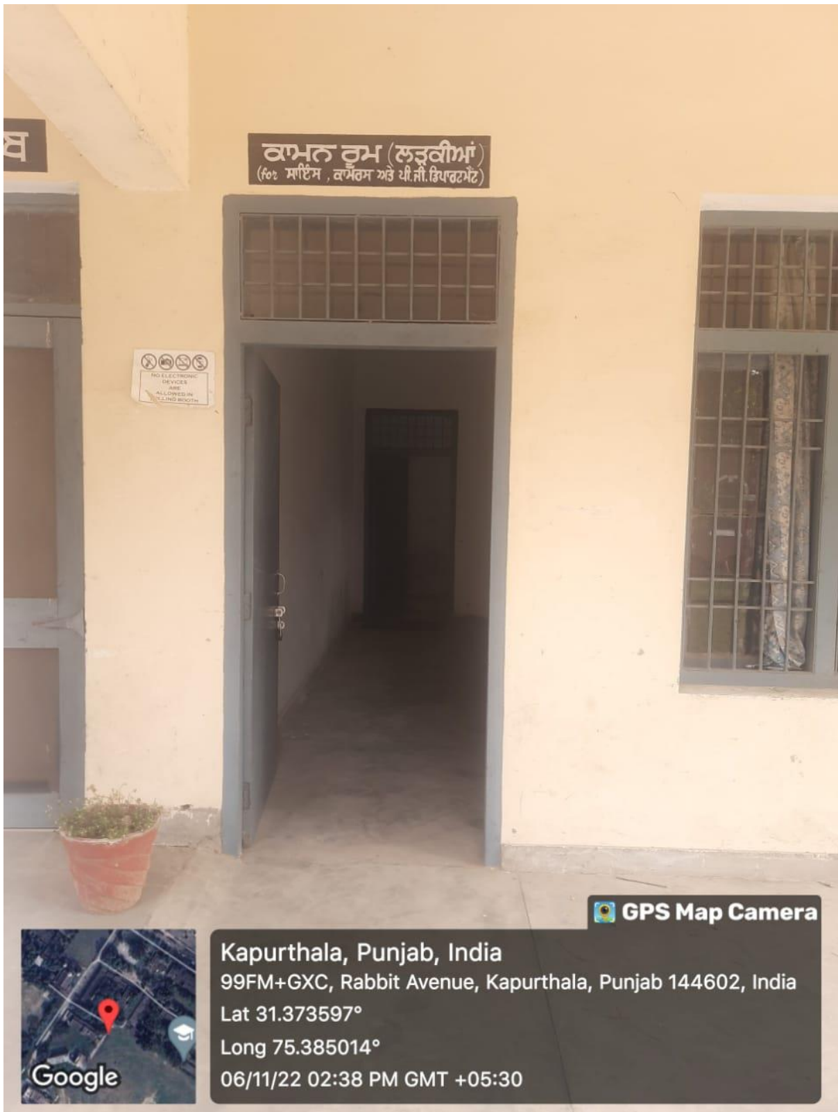
Common Rooms for Girls Student (1)