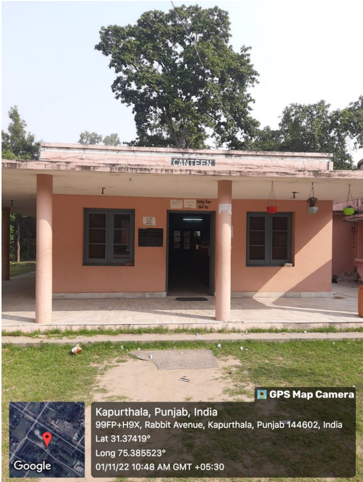
Separate Canteen Area for GIRLS only