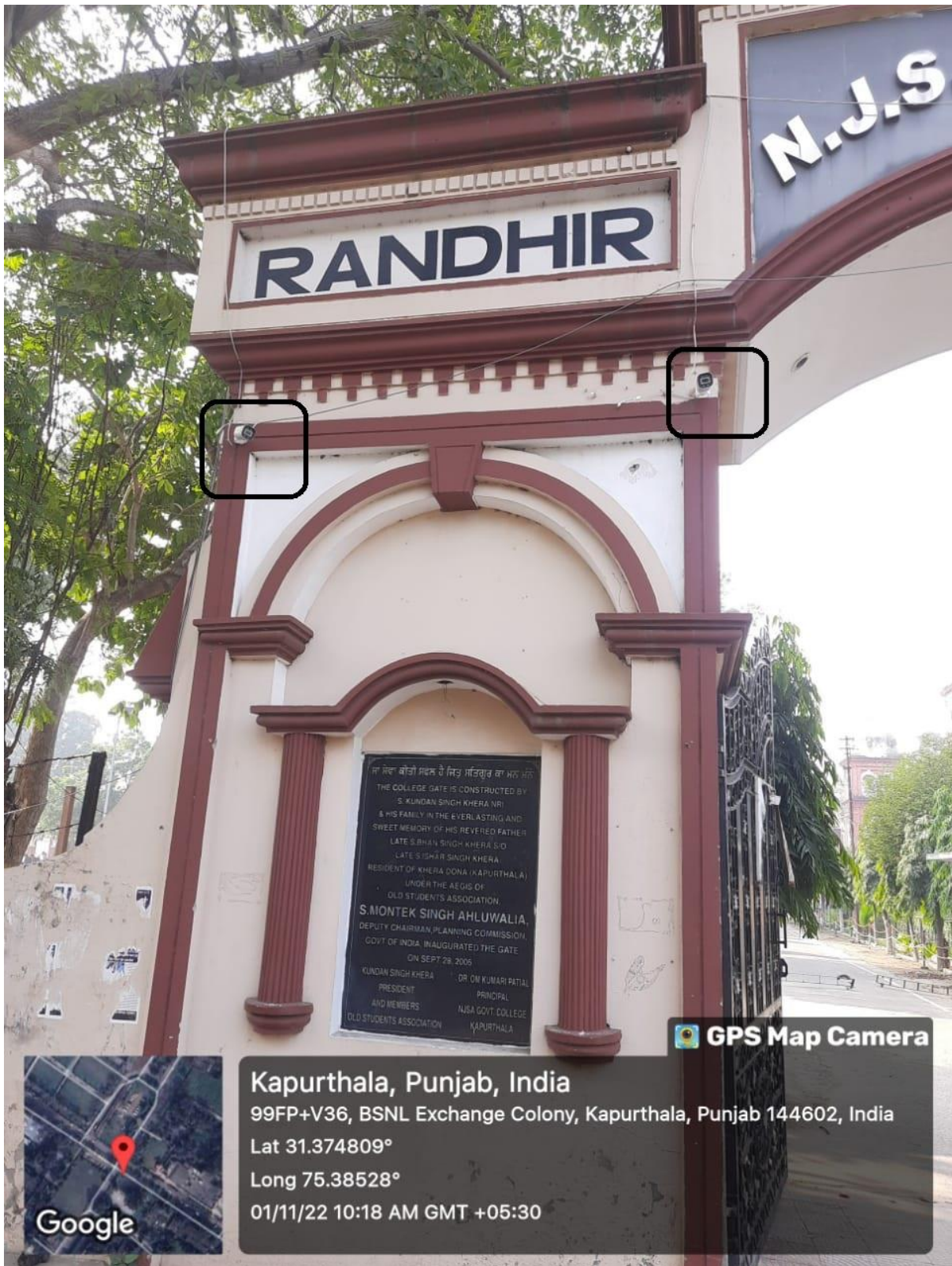
Security Cameras at the Entrance to ensure safety checks