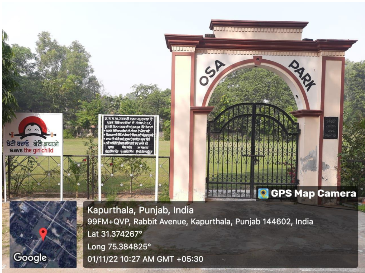
OSA Park for Girls Student Only