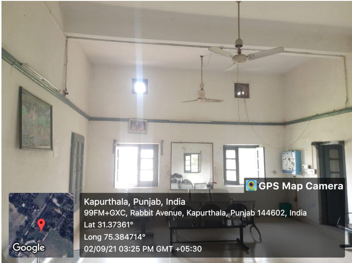
Common Rooms for Girls Student (2)